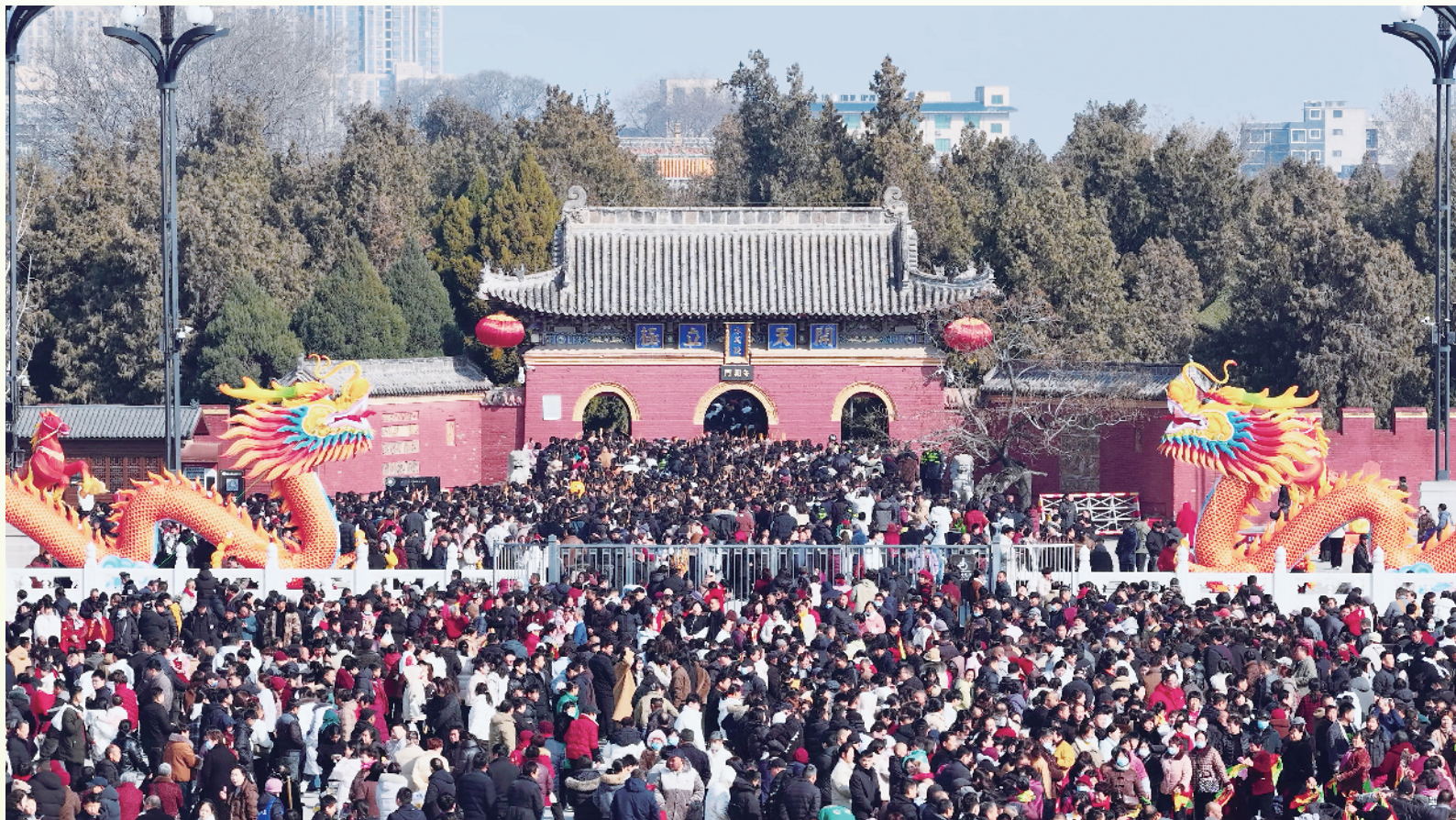
太昊陵庙会。

当二月的春风拂过淮阳龙湖的水面，一场延续千年的民间盛会便悄然开启。这就是太昊陵庙会——它不是一场刻意编排的民间演出，也不是仅供观赏的民俗集市，而是一代代中国人，用脚步和香火，走向同一个祖先的虔诚奔赴。